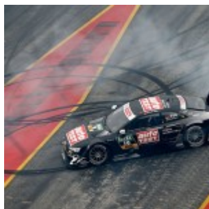
#10 Timo Scheider, Audi RS5 DTM