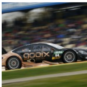
#94 Pascal Wehrlein, Mercedes-AMG C 63 DTM