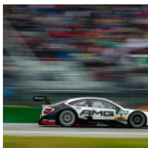
#3 Paul Di Resta, Mercedes-AMG C 63 DTM