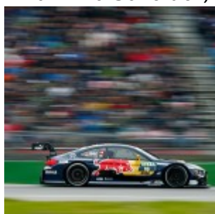
#13 António Félix da Costa, BMW M4 DTM