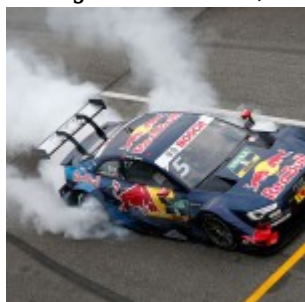
#5 Mattias Ekström, Audi RS5 DTM