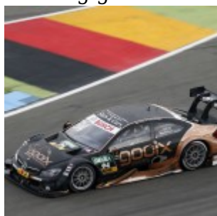
#94 Pascal Wehrlein, Mercedes-AMG C 63 DTM