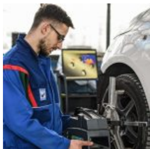
Messe Frankfurt Exhibition GmbH / Fotografo Pietro Sutera