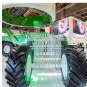
automechanika 2018 Messe Frankfurt Exhibition GmbH / Fotografo Jochen Günther