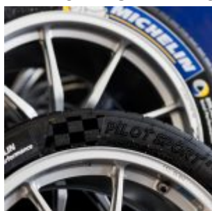
FIA FORMULA E HONG KONG, Round 1, 9 october 2016.