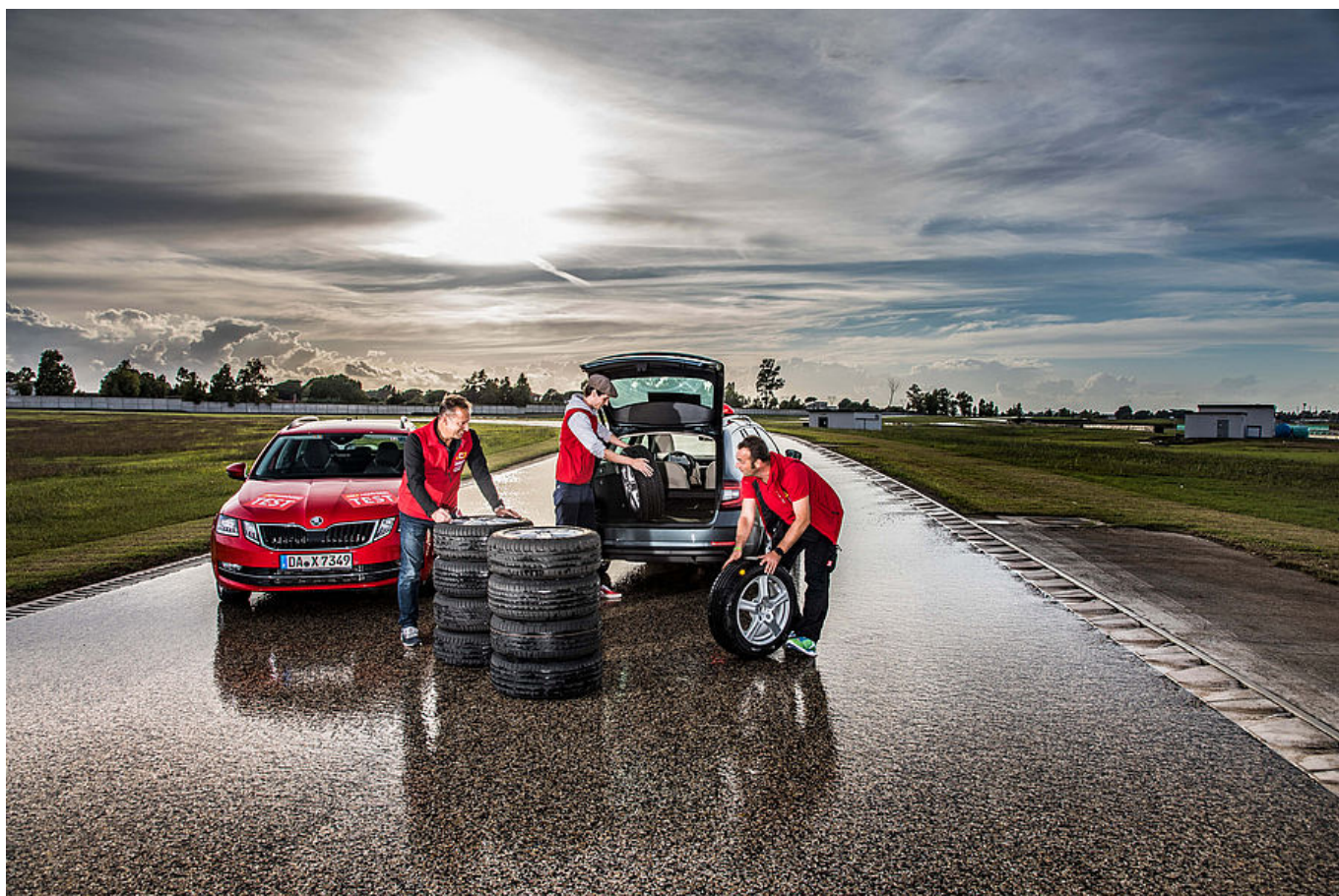
I test sono stati realizzati nell'autunno 2018 presso il centro prove italiano di Bridgestone