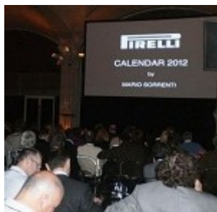
La conferenza stampa al Guastavino di New York