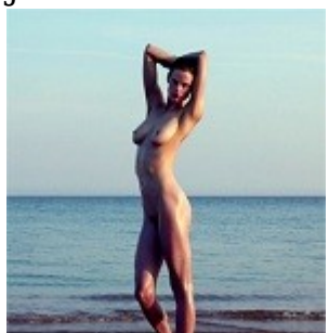
Saskia de Brauw