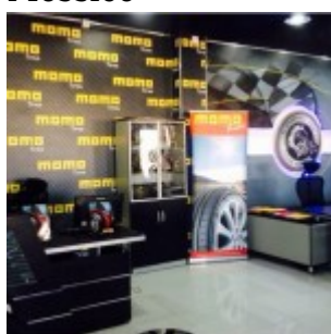
Il punto vendita Momo Tires a Dubai