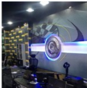
Il punto vendita Momo Tires a Dubai