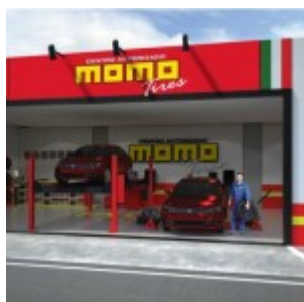
Rendering del punto vendita Momo Tires in franchising che verrà lanciato a breve in Messico

Oggi Momo Tires dispone di 250 diverse referenze di cui 104 nel segmento Winter. Inoltre sono in fase di industrializzazione 14 nuove referenze su segmenti ancora non trattati. La novità più importante, della quale l'azienda non rilascia anticipazioni, sarà presentata durante la fiera di Bologna.