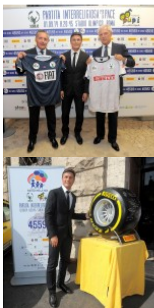
© riproduzione riservata pubblicato il 27 / 08 / 2014