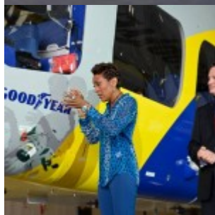
Robin Roberts battezza il dirigibile